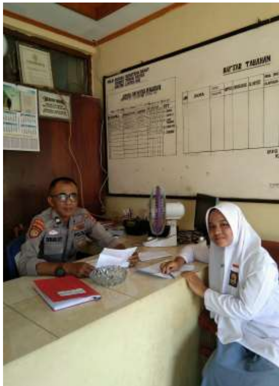
Gambar 3. Dokumentasi Penelitian di Kantor Pemerintahan Daerah dan di Kantor Kapolsek