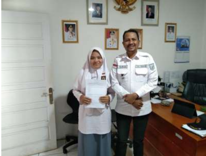
Gambar 2. Dokumentasi Penelitian di Kantor Pemerintahan Daerah dan di Kantor Kapolsek